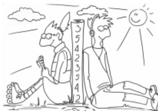
...фиксировать размер столбца... вписывать доли балла, которые студент может заработать...