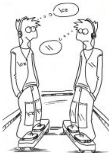
Тело таблицы, набранной с помощью \halign , почти не отступает от тела таблицы внутри окружения tabular ...

В качестве примера сверстаем (слегка усложненную) таблицу из раздела «Имита-